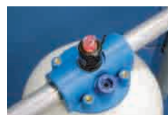
カートリッジ交換期(赤)